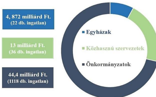
1. ábra: 2008 és 2016 között ingyenesen átruházott állami ingatlanok összértéke és kedvezményezettek szerinti megoszlása